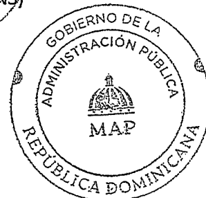
Lic. Darío Castillo Lugo Ministro del Ministerio de Administración Pública (MAP)